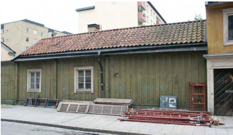
Hus III, foto före ombyggnaden 2004.