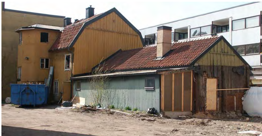
Före ombyggnaden, 2004. Hus III med utbyggnad försedd med plåtfasad. Trapphuset till hus IV hade fasad av sinus-korrugerad plåt.