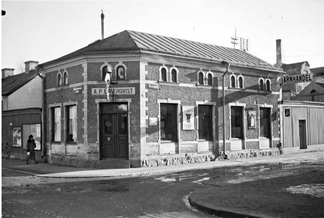
Lagerqvists järnhandel på 1930-talet.