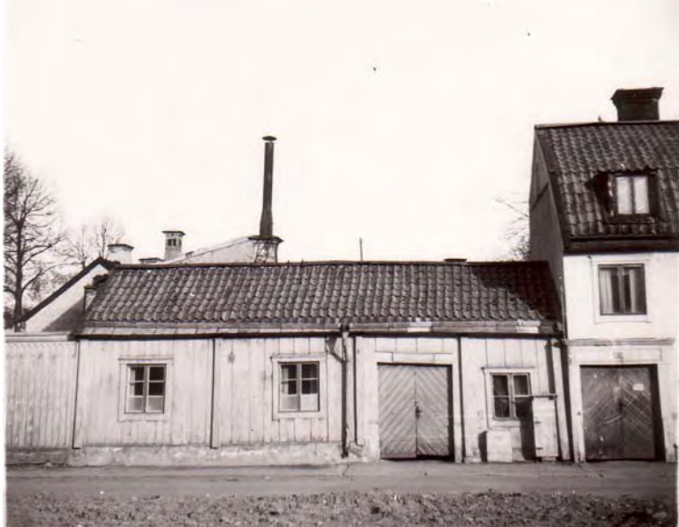
Hus III, foto från 1950-talet av landsantikvarie Nils Sundquist, som fotograferat från en av de avrivna tomterna i kv Hästen.

Den f.d. butiksentrén i hörnet mot gatan har ersatts av ett fönster. På gårdssidan har fasaden putsats och nya fönsteröppningar tagits upp och en ny entré. De gamla skyltfönstren har ersatts av nya fönster med T-post. En gårdsutbyggnad med plåtfasad revs före ombyggnaden. Det är okänt när den utbyggnaden uppförts.