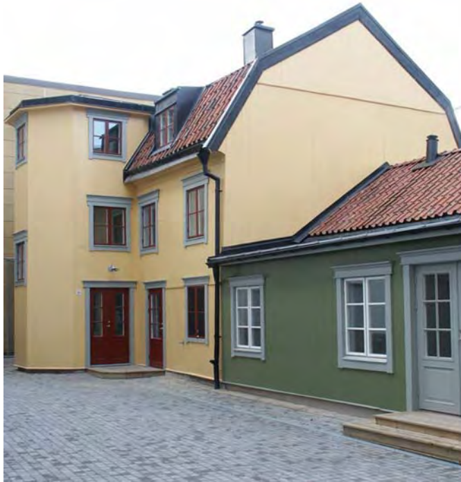
Gårdsbild hösten 2006. Till höger ses den nya utbyggnaden på hus III. Trapphuset på hus IV är försett med ny fasadpanel och ny dörr.

Vidare har huset försetts med nya kopplade, spröjsade fönsterbågar. Omfattningar och profilerade överstycken till fönstren har utförts som kopior av de gamla. Det sydöstra gavelröstets panel har lagats och kompletterats samt målats i en brun färg. Den östra gavelns puts har reparerats och målats med organisk färg i gult lika övriga fasader. Huset har även försetts med ny fotbräda ovanpå sockeln och nya vindskivor. Porten mot Vretgränd har strukits med trätjära. För att släppa in dagsljus till bakomliggande kokvrå togs två små fönstergluggar upp i porten.