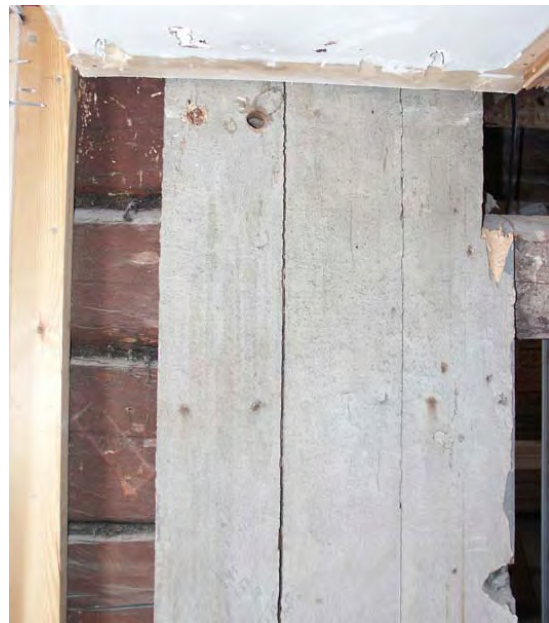
Hus IV, panel med grå originalfärg och rödfärgad timmerstomme som framkom under rivningsarbeten

På östra gaveln till hus III dokumenterades panel och stomme sedan huskroppen mellan hus I och III rivits. Där syntes spår av rödfärg på knutbräderna, vilket tyder på att byggnaden kan ha haft rödfärgad panel i ett tidigare skede. Här fanns även omålad panel som tidigare doldes bakom den rivna huskroppen. Panelen hade kvar ursprungliga skarpa profiler eftersom bräderna inte varit exponerade för väder och vind.