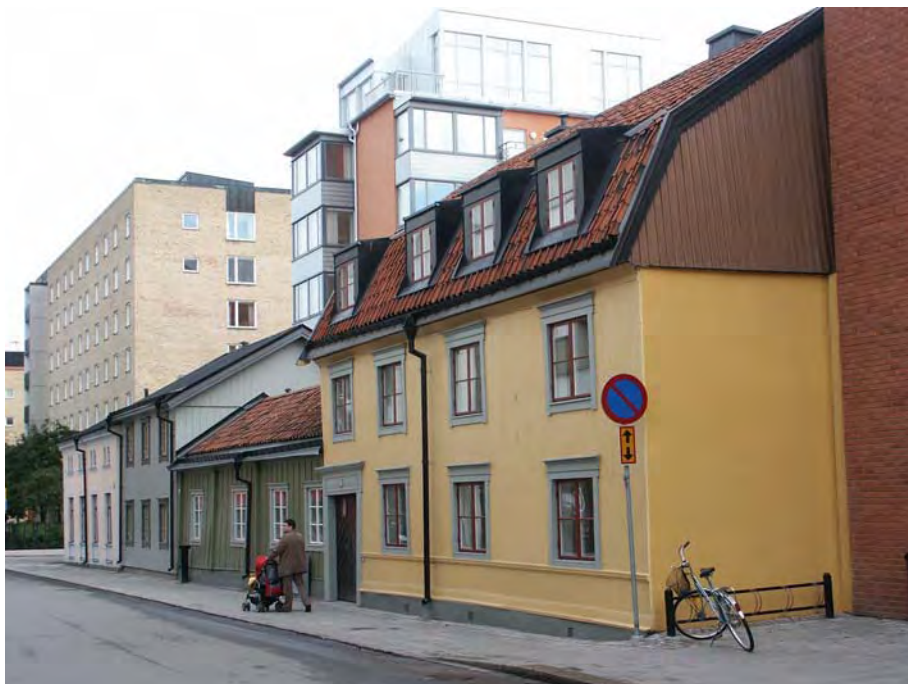
Vretgränd okt 2006, närmast i bild hus IV.

Byggnaderna var flera gånger ombyggda invändigt. Det fanns inte mycket kvar av ursprunglig fast inredning. I hus IV har ursprungliga brädtak bevarats på bottenvåningen.