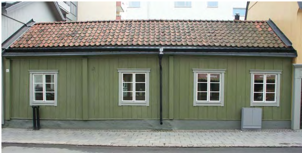
Hus III, foto okt 2006.

På gårdssidan finns en låg utbyggnad klädd med ny fasadpanel av traditionell typ.