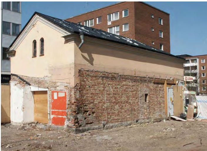
Hus I, gårdsfasaden före ombyggnaden, sedan en lägre utbyggnad mot gården rivits, och nedan efter ombyggnaden.