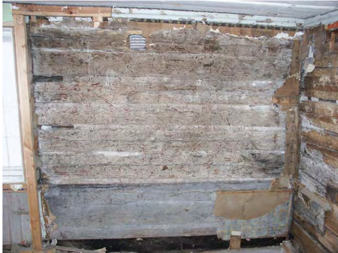
Stänkmålad vägg i hus IV