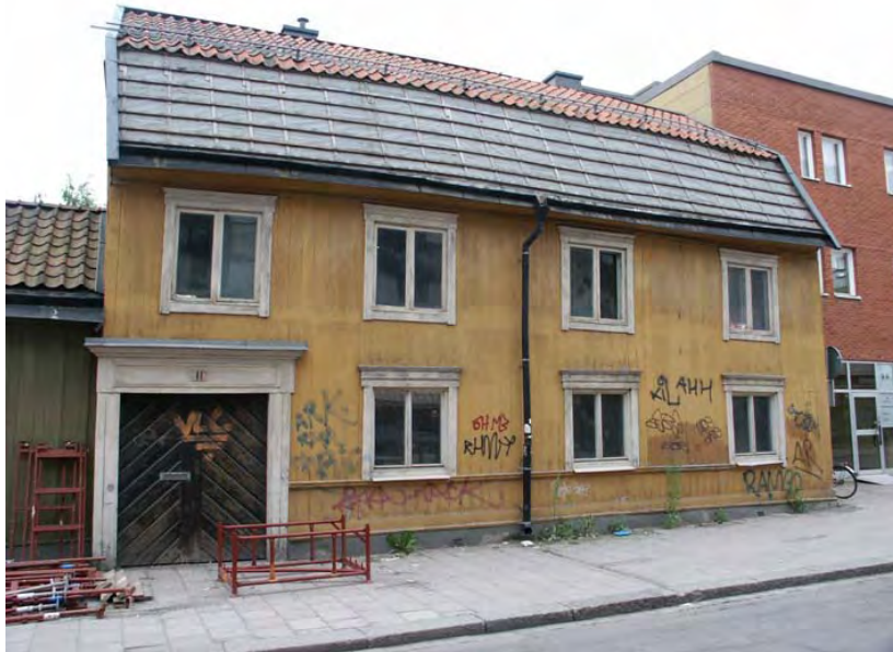
Hus IV före ombyggnaden, april 2004.

Den största utvändiga förändringen består i de nya takkuporna mot Vretgränd. Vidare har trapphuset mot gården försetts med ny panel i stället för den sinus-korrugerade plåt som tidigare klädde trapphusets fasad. Trapphusets panel är släthyvlad och spontad lika husets gamla panel. Trapphuset har även lyfts och försetts med ny betonggrund, i stället för den gamla stensockeln, samt en ny entrédörr. På gårdssidan har en ny dörr tagits upp på platsen för ett gammalt fönster, vilken leder in till bottenvåningens bostad. Ett blindfönster har satts in bredvid dörren för symmetris skull. Övervåningens bostad nås via trapphuset.