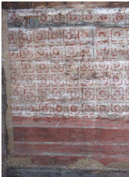
Limfärgsmålad vägg med schablonmåleri i hus IV