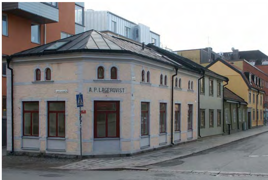
F.d. järnhandeln, hus I, foto okt 2006. Därefter ses det nybyggda hus II, det envåninga hus III från 1772 och hus IV från 1825 i två våningar.

Detta är det f.d. järnhandelshuset byggt efter ritningar från 1900. Det är byggt i en och en halv våning med stomme av tegel på en grund av huggen natursten. Fasaderna är spritputsade och försedda med slätputsade listverk och omfattningar.