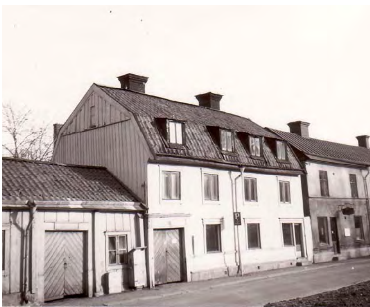
Hus IV på 1950-talet.

Enligt färgdokumentationen har fasaden ursprungligen varit ljust ockragul med fönsteromfattningar i brutet vitt. Museets förslag, att måla om med linoljefärg i ursprunglig kulör, följdes inte. Fasadpanelen har i stället målats med grön alkydoljefärg i en kulör som ligger nära den färg huset hade före ombyggnaden.